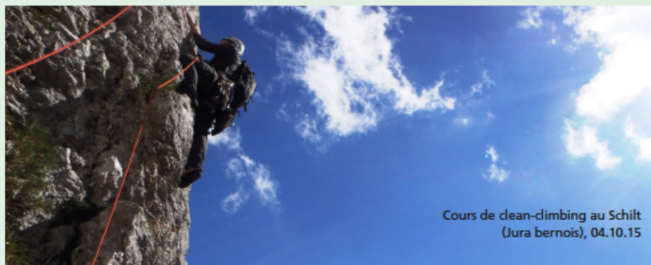
Cours de clean-climbing au Schilt (Jura bernois), 04.10.15