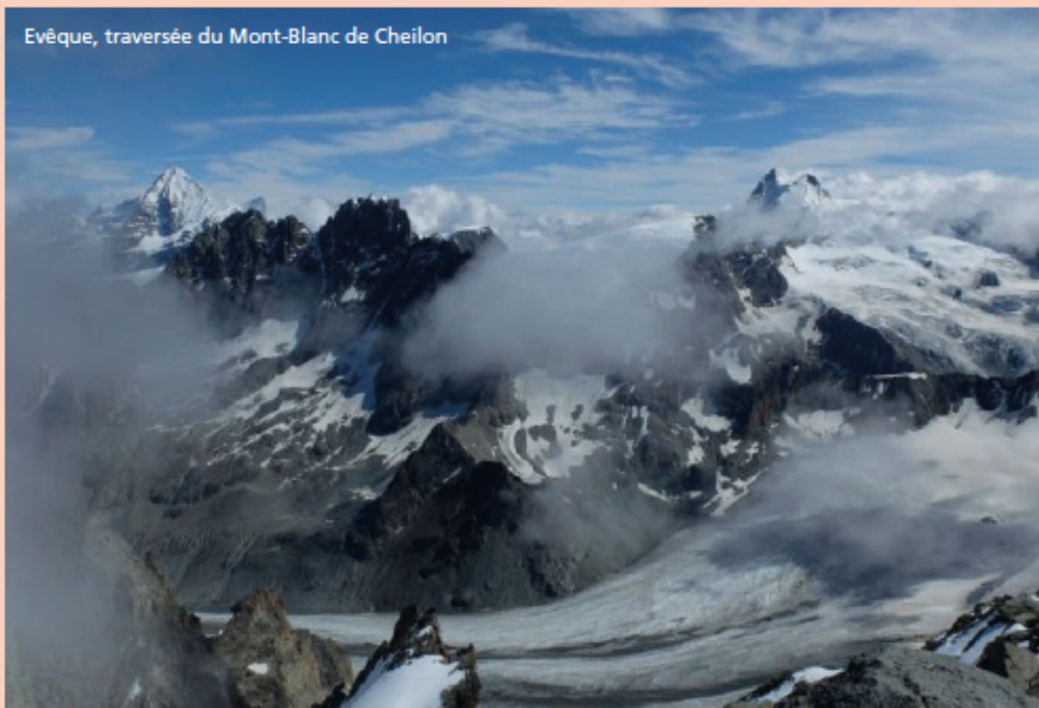
Evêque, traversée du Mont-Blanc de Cheilon