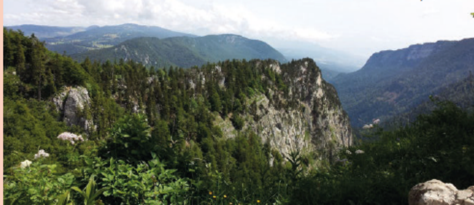
Creux du Van, Dos d'Ane