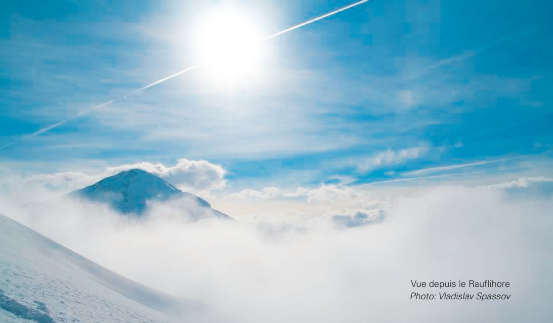
Vue depuis le Rauflihore