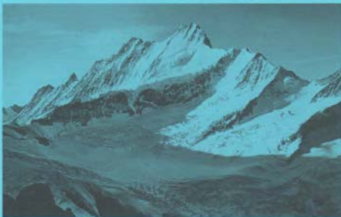
Le Schreckhorn (4078 m) et à gauche le Lauteraarhorn (4042 m), vus depuis le cheminement conduisant de la cabane Gleckstein vers le Rosenhorn.

} pour quelques courses exceptionnelles et pour les cotations d'escalade en falaise