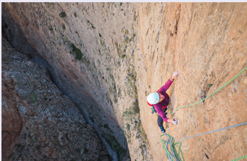
Christelle dans les Rivières Pourpres sur Taoujdat, Taghia