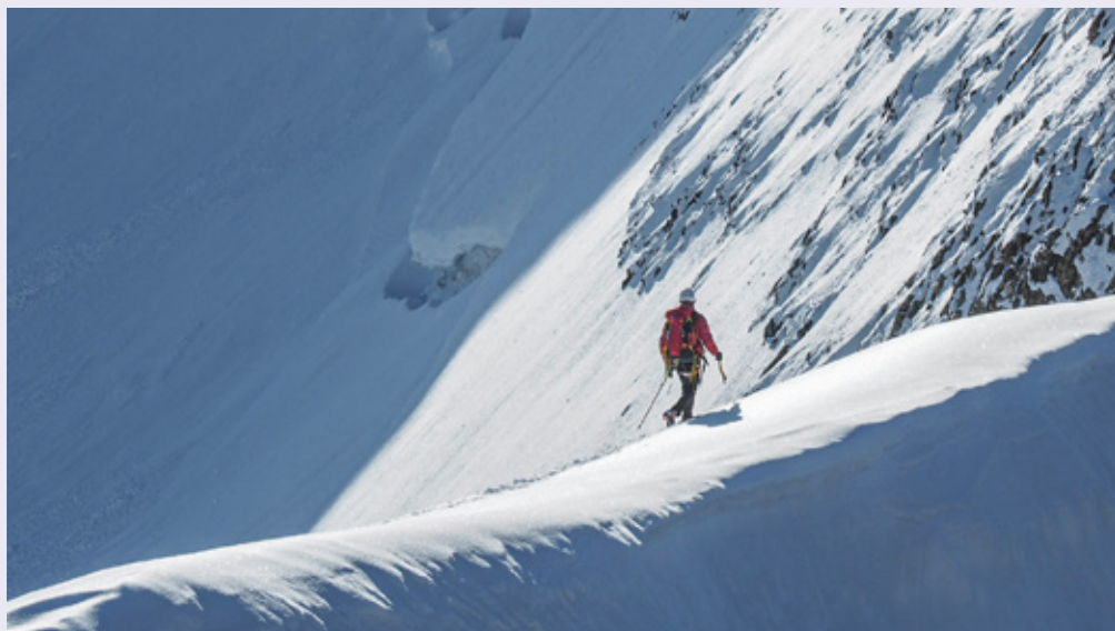
Vincent à la recherche du déco idéal au sommet du Dôme de Neige des Écrins