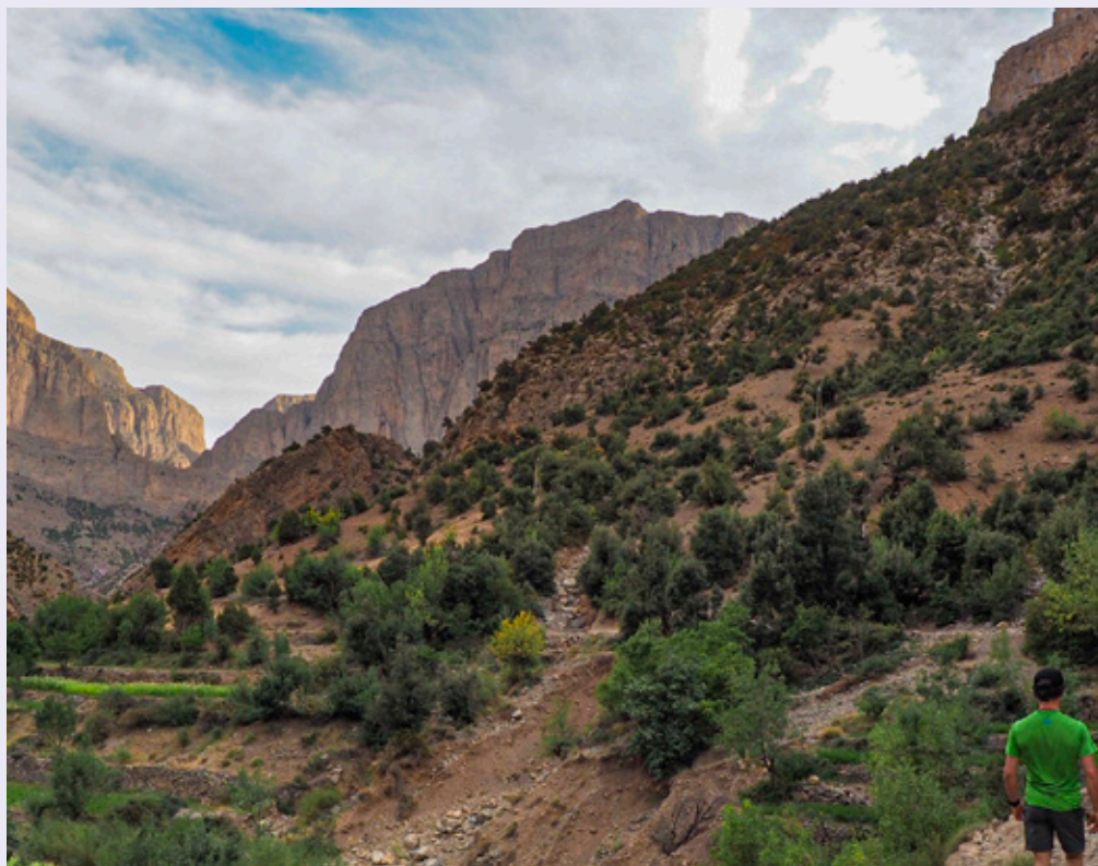
Arrivée à Taghia, les falaises se dévoilent