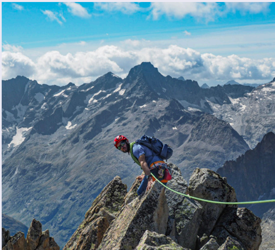
Jérôme sur l'Aiguille centrale du Soreiller